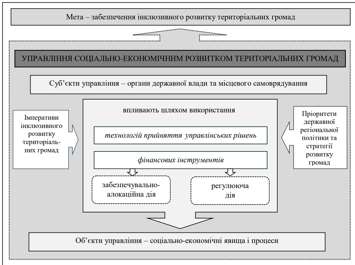
Рис. 2. Концептуальна модель використання фінансових інструментів як домінанти забезпечення інклюзивного розвитку територіальних громад Примітка: розроблено авторами