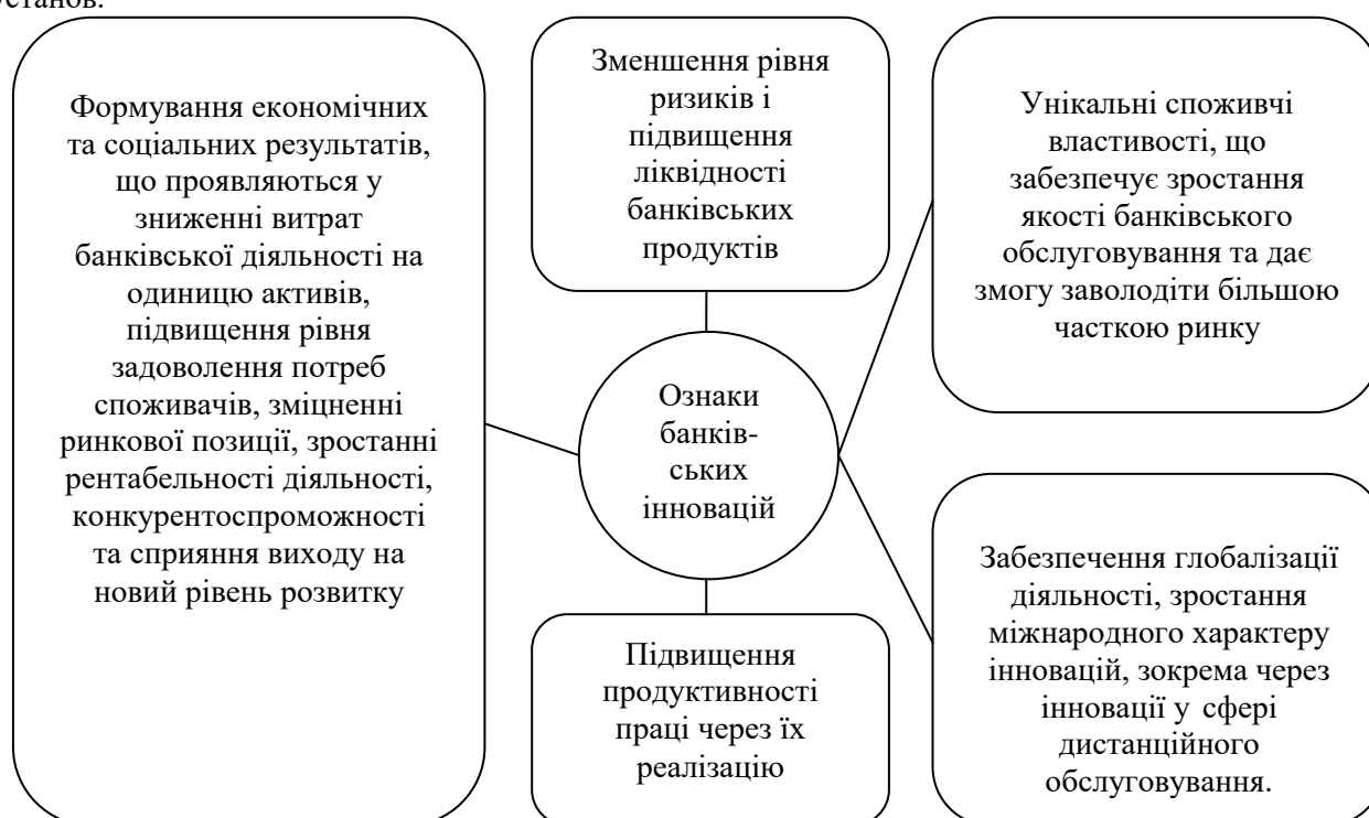
Рис. 1. Ознаки банківських інновацій за ідентифікатором

банківських установ, інформація про сучасні банківські нововведення за кордоном, періодичні кризові коливання в банківській галузі, що, в свою чергу стимулює до пошуку нових рішень та потенційних можливостей для підвищення фінансової стійкості та фінансової безпеки банківських установ.