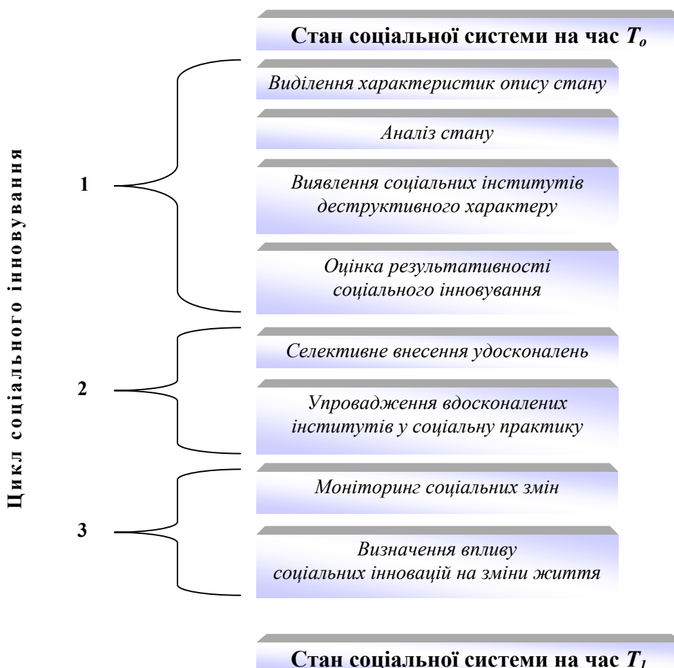
Рис. 1. Пофазові складники циклу соціального іннування

виникають спонтанно, кероване соціальне іннування передбачає впровадження механізму їх ініціювання й контролю. На нашу думку, соціальне іннування як безперервний повторюваний циклічний процес у найбільш простому, але об'єктивному відтворенні формується з трьох фаз (рис. 1). У житті ми маємо справу не стільки з реальними соціальними об'єктами та інститутами, скільки з інформацією про них. Тому в першій фазі, яку можна назвати аналітичною, за визначенням А. Маршалла; «... предметом вивчення є факти, які можна спостерігати, і величини, котрі можна виміряти й зафіксувати» [14, с. 83]. У контексті цих вимог формується блок кількісних і якісних характеристик, оптимізується їх набір, визначаються їхні зміни й деструктиви в них. У цій фазі виявляються соціальні інститути, які потребують змін. При цьому обов'язково враховується той факт, що будь-яка зміна протиставляє чинні соціальні інститути модернізованим. Проведені дослідження свідчать про необхідність у цій фазі ще однієї дії. Ідеться про оцінку результативності соціального іннування. Момент оцінювання фіксує процес порівняння з параметрами, закладеними в проект.