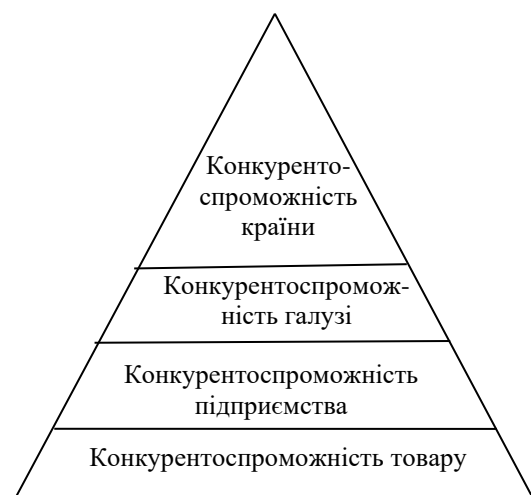
Рис. 1. Рівні конкурентоспроможності