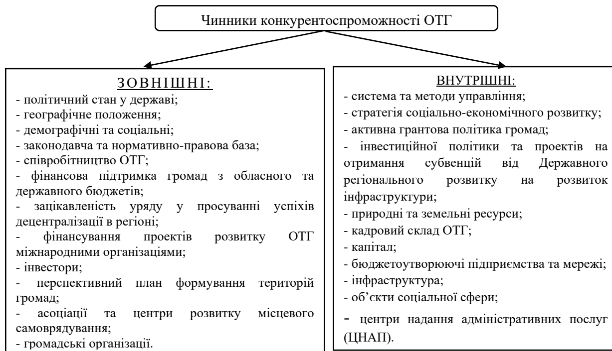
Рис. 2. Чинники конкурентоспроможності ОТГ

Однак на функціональному рівні такий абстрактний підхід не дає чіткої відповіді на питання щодо конкретних винників, які визначають рівень конкурентоспроможності ОТГ. Такі чинники уже будуть відрізнятися в різних ОТГ, оскільки різний рівень розвитку територій не дозволяє усюди визначати однакові чинники як за якісним, так і за кількісним їх рівнем.