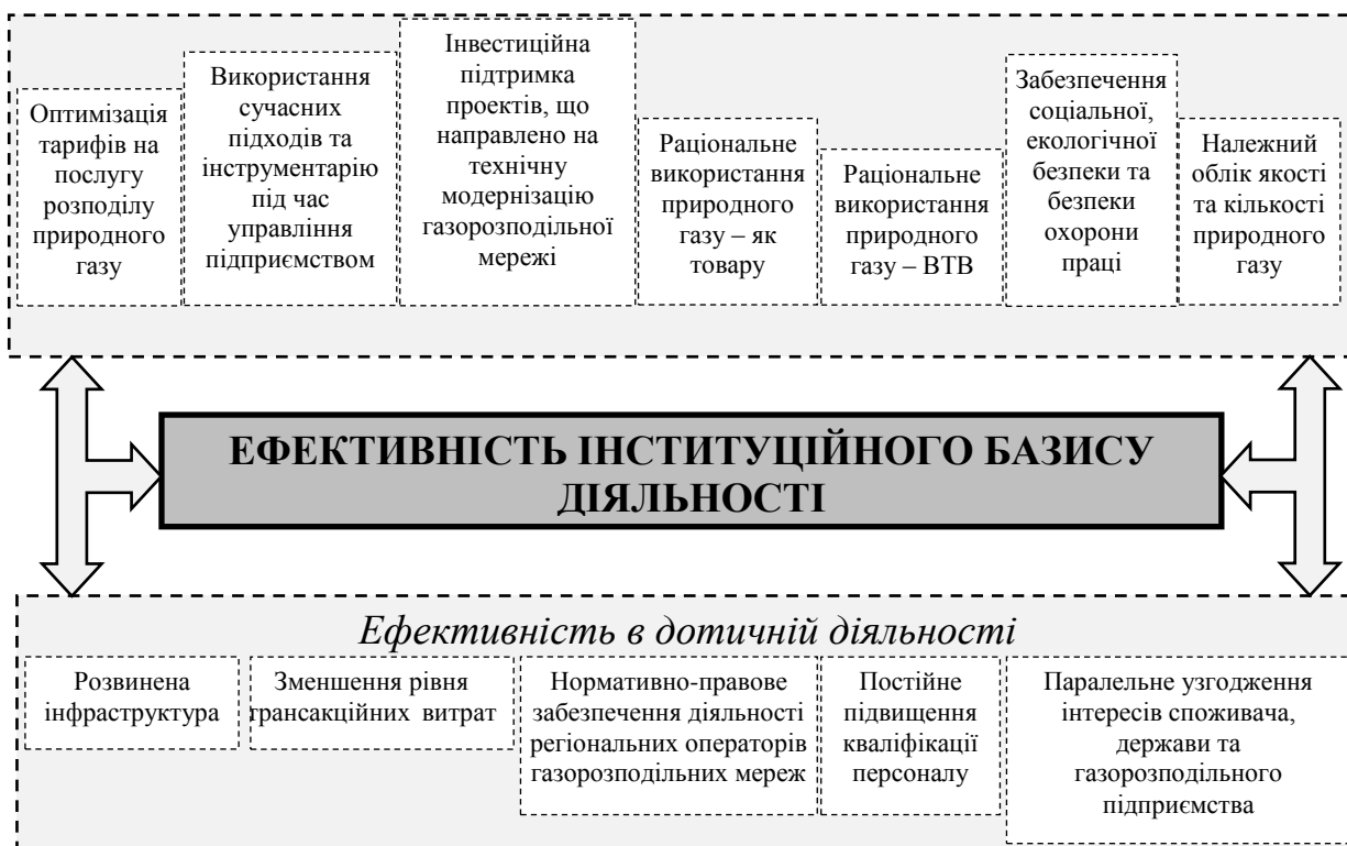
Рис. 3. Інституціональне забезпечення функціонування та розвитку ГРПЗР

На нашу думку, саме утворення інституціональних підходів та інструментів для їх реалізації сприятиме підвищенню рівня ефективності функціонування газорозподільних підприємств регіону, підвищенню рівня якості послуг що надаються та з рештою, стимулюватиме абсолютно усіх учасників ринку розподілу серед споживачів природного газу в регіоні.