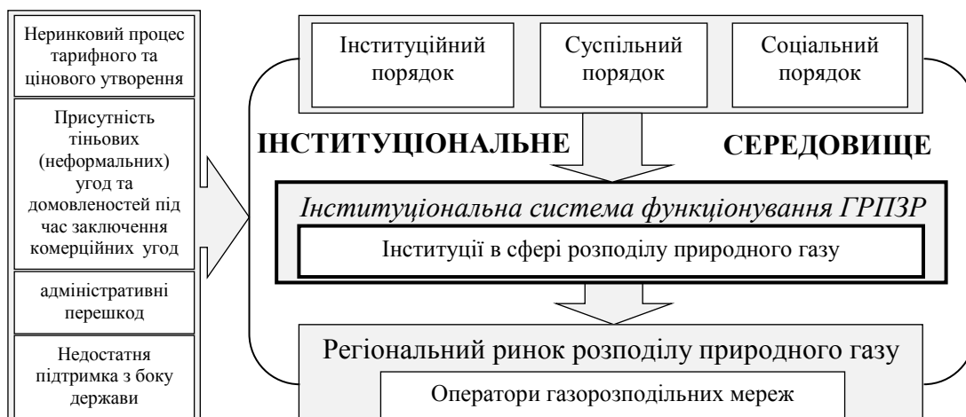
Рис. 1. Послідовності взаємозалежностей та впливу компонентів на інституціональне середовище функціонування газорозподільних підприємств західного регіону.

Діюча на сьогодні інституціональна система функціонування ринку розподілу серед споживачів природного газу, а також його суб'єктів в Україні загалом та її регіонах не забезпечує в повній мірі вимог сьогодення (Рис. 1).