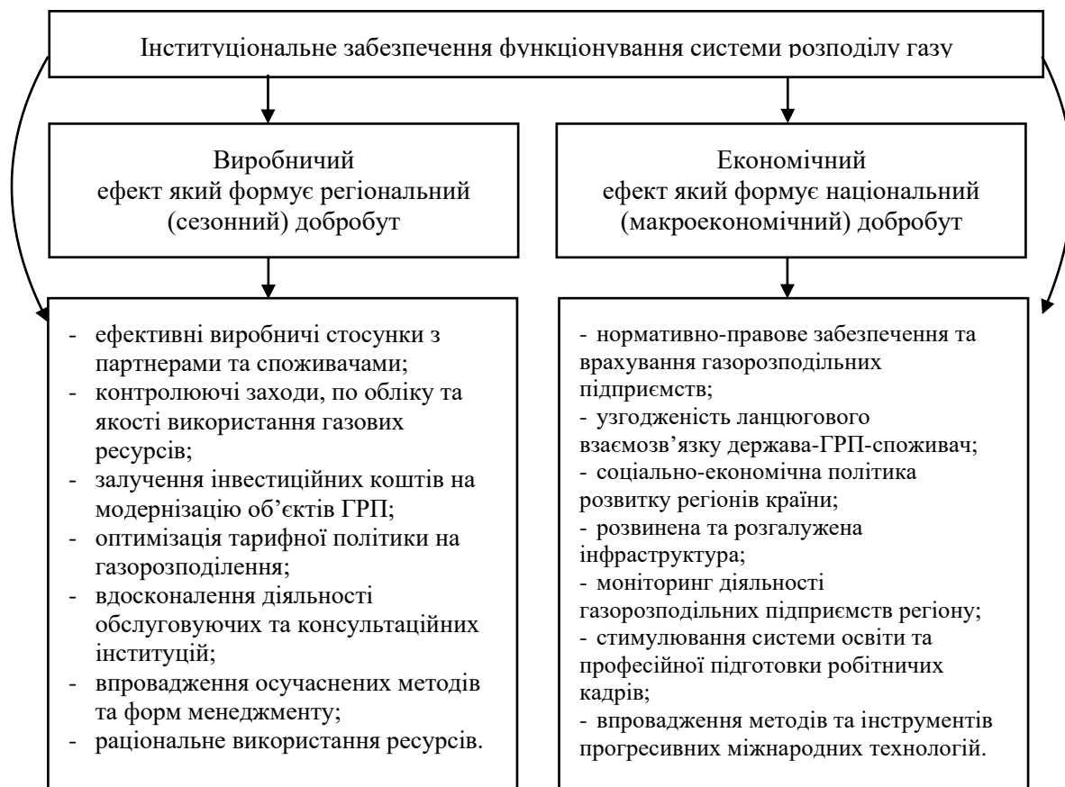
Рис.3. Удосконалено та систематизовано автором на основі [6].

Ще одним аспектом збільшення ефекту інституціонального середовища є інвестування капітальних ресурсів та подальша приватизаційна практика газотранспортних та газорозподільних підприємств. Однак за сучасних економічних та політичних обставин ця практика унеможливується [3].