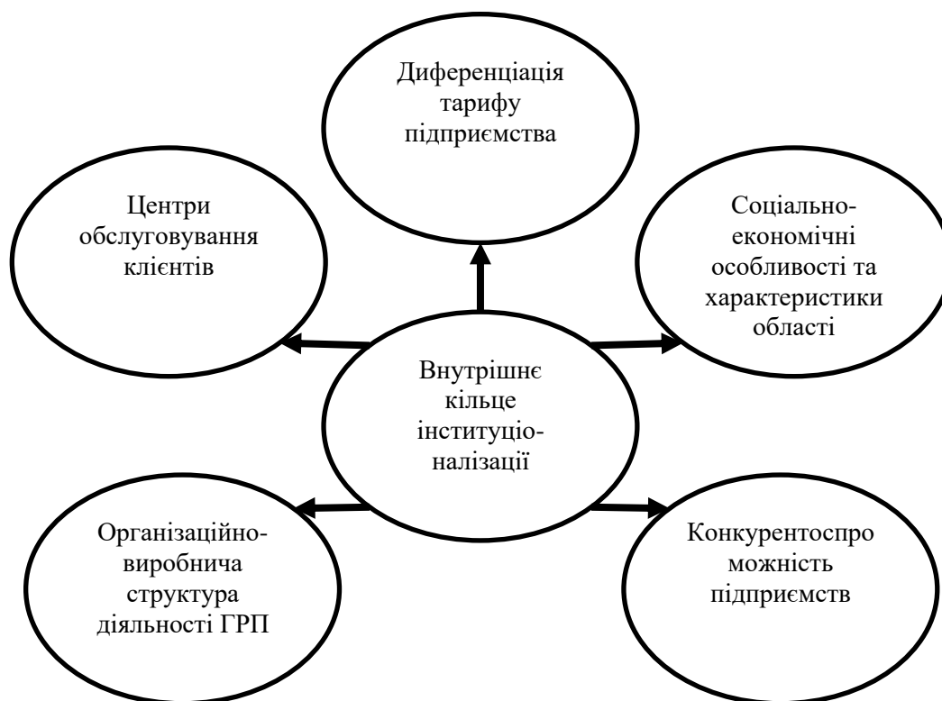
Рис.2. Внутрішнє кільце інституціонального середовища ГТП.