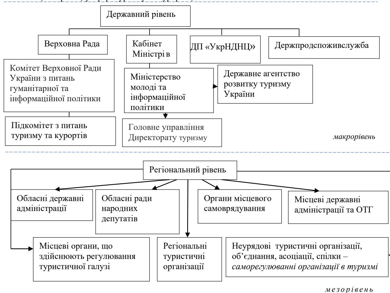
Рис. 3. Інституційне забезпечення ринку туристичних послуг в Україні станом на 2020 рік