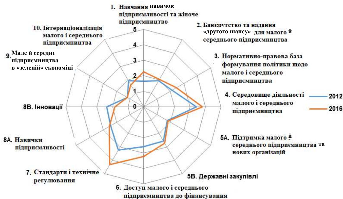
Рис. 4. Індекс економічної політики у сфері малого й середнього підприємництва, Україна (2012, 2016 рр.)