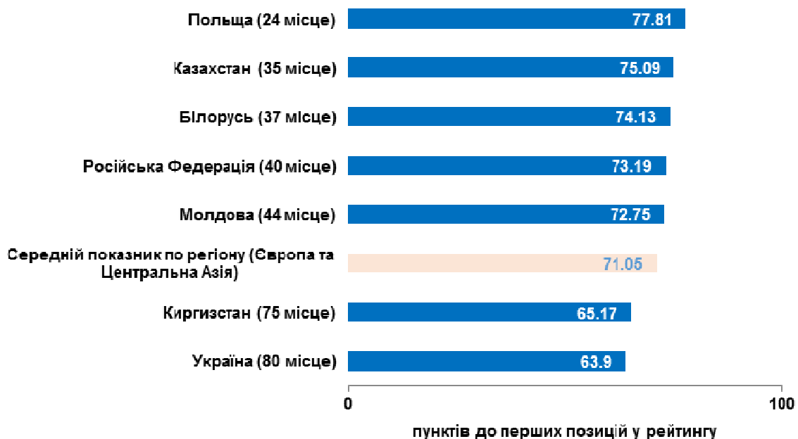
Рис. 2. Рейтинг України та подібних економік за критерієм «Індекс ведення бізнесу» у 2017 р.

На рис. 2 зображено позицію, яку посідає Україна за показником «Індекс ведення бізнесу», порівняно з економіками сусідніх держав. Усі країни в групі випереджають Україну. Лідером серед наведених держав є Польща (24 місце в рейтингу). Сусідня Білорусь займає 37 місце, Російська Федерація – 40. Україна відстає від регіону в цілому щодо кількості пунктів до перших позицій у рейтингу, тобто до країни-лідера в рейтингу [5].