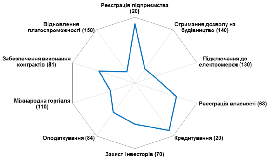
Рис. 3. Показники Індексу ведення бізнесу в Україні у 2017 р.

Індекс ведення бізнесу включає 10 показників: реєстрація підприємств; отримання дозволів на будівництво; реєстрація власності; кредитування; захист інвесторів; оподаткування; міжнародна торгівля; забезпечення виконання контрактів; відновлення платоспроможності. На рис. 3 зображено позиції України за показниками індексу ведення бізнесу. У центрі діаграми позиціонується кількість країн – 190, рух до крайньої межі характеризує наближення до держави-лідера.