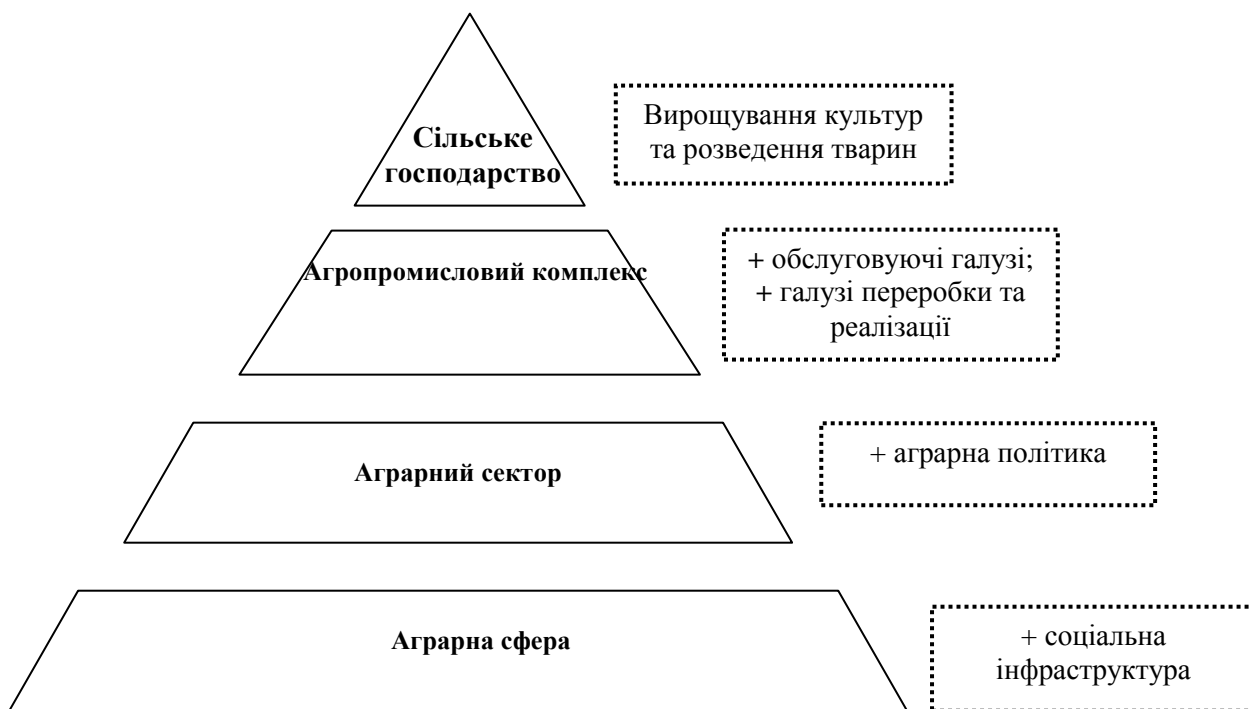
Рис. 1. Місце аграрної сфери серед інших аграрних категорій

Узагальнюючи проведений теоретичний аналіз, категоріальний апарат розвитку аграрної сфери можна систематизувати від більш вузької дефініції «сільське господарство», що являє собою сукупність підприємств, спеціалізованих на виробництві продукції тваринництва й рослинництва, до найбільш широкої, котрою є «аграрна сфера» (рис. 1).