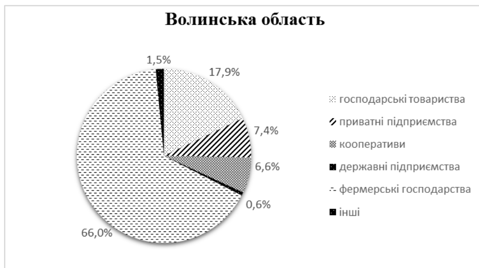
Рис. 1. Структура сільськогосподарських підприємств Волинської області в розрізі організаційно-правових форм суб'єктів економіки

Співвідношення між організаційно-правовими формами діяльності сільськогосподарських товаровиробників Волинської області в цілому відповідає структурі по країні.